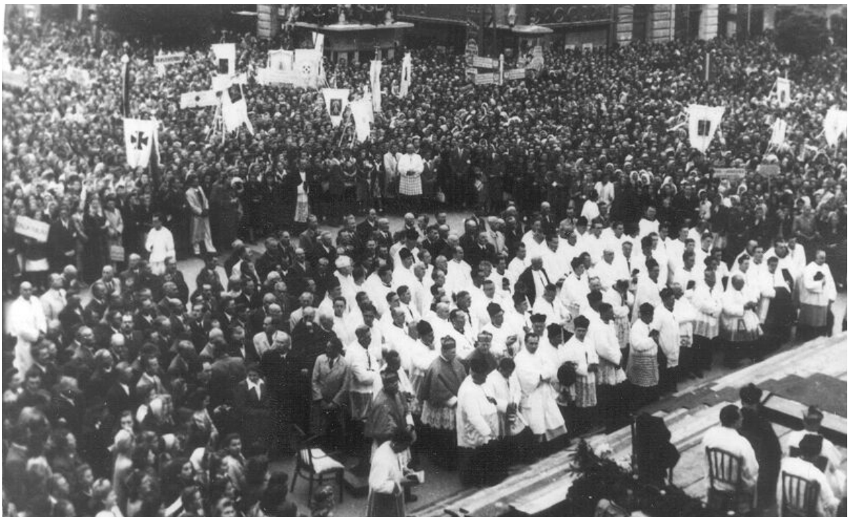
1. A papok és az ünneplő tömeg a Mária Magdolna templom előtt szeptember 8-án.